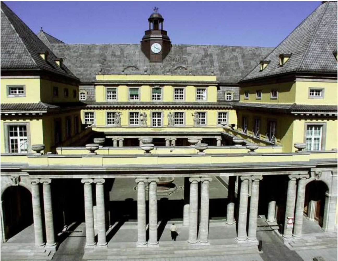
Glavni ulaz u zgradu Munich Re-a

U ranim godinama poslovanja Munich Re je imao tri veće krize – požare u Baltimoru 1904. i San Franciscu nakon potresa, 1906., kao i I svjetski rat. Požar u San Franciscu je koštao Munich Re 11 miliona maraka. 1914. godine Munich Re je imao premijski prihod od 204 miliona zlatnih maraka, a 69% premije je dolazilo iz inozemstva. Premijski prihod 1922. je iznosio 50 miliona maraka, a preći će 125 miliona maraka premijskog prihoda tek 1924.-1925. 1927. je bio drugi po veličini reosiguravatelj u svijetu, iza Swiss Re-a.