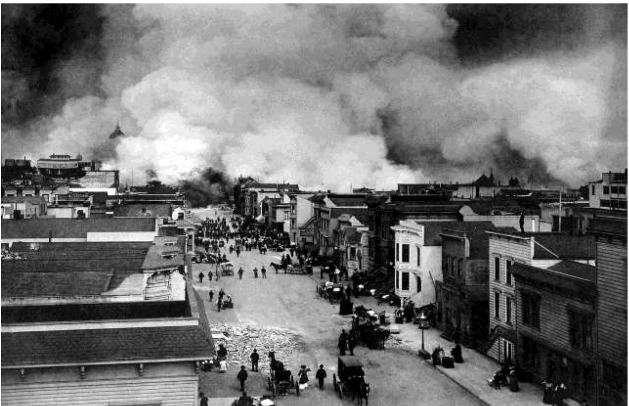
Požar u San Franciscu nakon potresa

18. april 1906. - Potres i požar u San Franciscu, (procjena ekonomske štete 10 milijardi dolara po današnjim vrijednostima. 43 društva su po današnjim vrijednostima platile osigurane štete u visini od 4,9 milijardi USD). Iako je procjena da je oko 90% domova imalo osiguranje od požara, rizik potresa je smatran neosigurljivim. Mnoga osiguranja su i izričito isključila požar nastao nakon potresa. Neka osiguranja su odbila platiti štetu, neka su plaćala i propala, neka su ponovo pregovarala o uvjetima osiguranja.