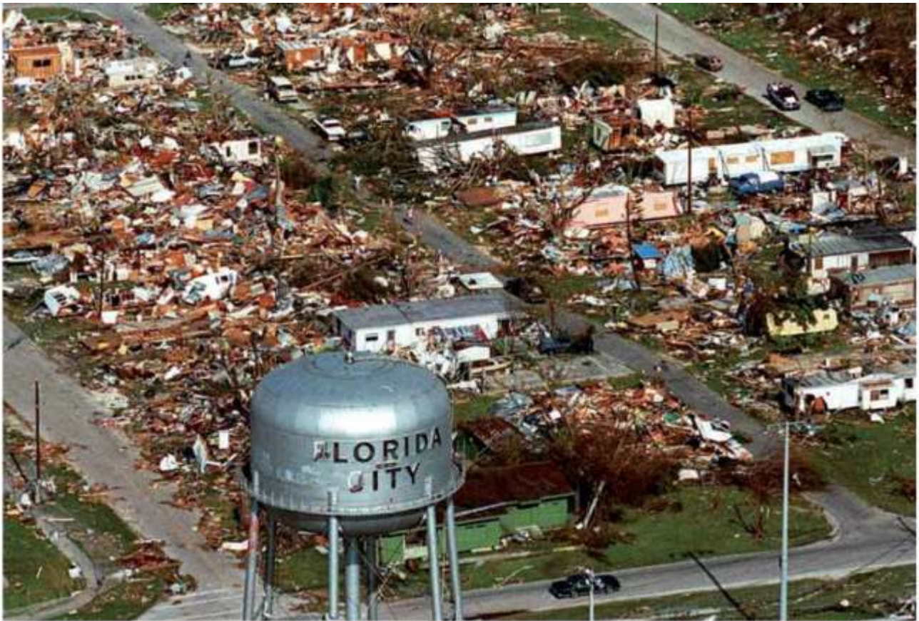
Posljedice uragana Andrew, Florida City

August 1992. - Uragan Andrew, procjena ekonomske štete 22 milijarde USD