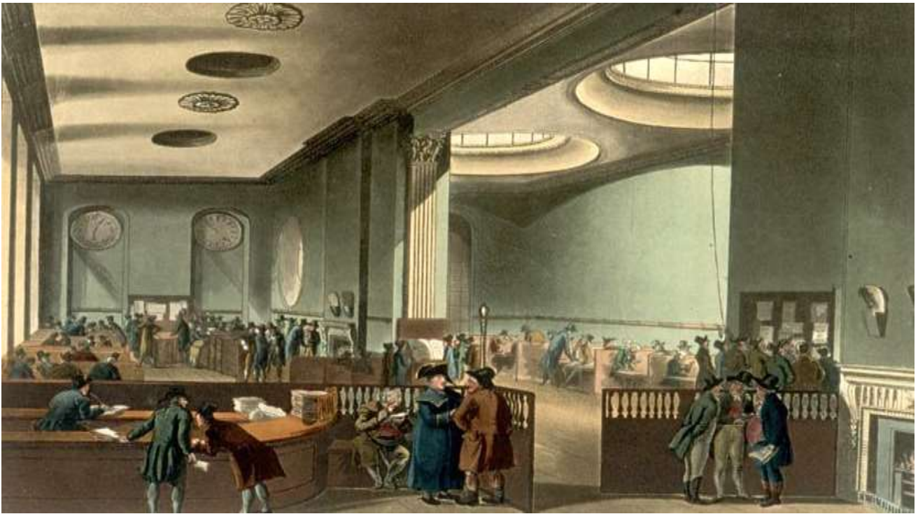
Lloyd's u 19. stoljeću