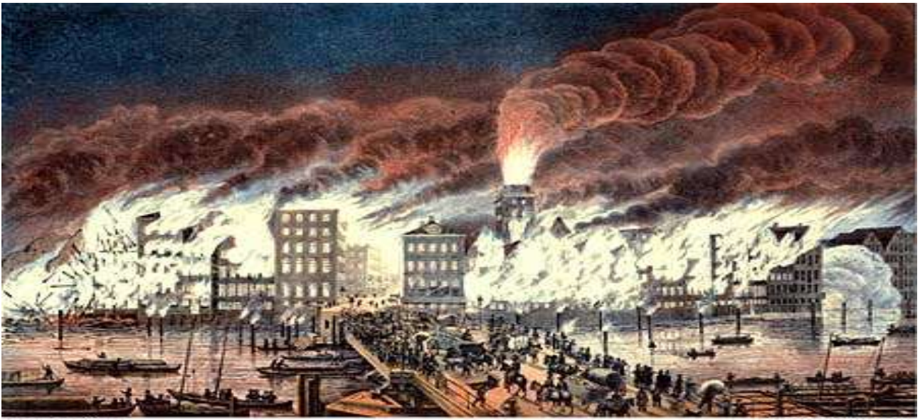
Der Brand der Nicolai-Kirche in der Nacht vom 5 ten auf den 6 ten Mai 1842, von der Holzbrücke gesehen