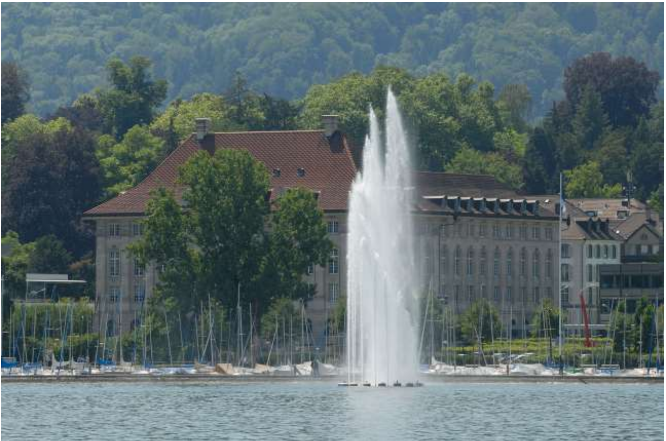
Sjedište Swiss Re-a u Cirihi

1880. je Swiss Re preuzeo prvi posao iz SAD, a 1882. je sklopljen i prvi potpisani ugovor sa društvom iz SAD.