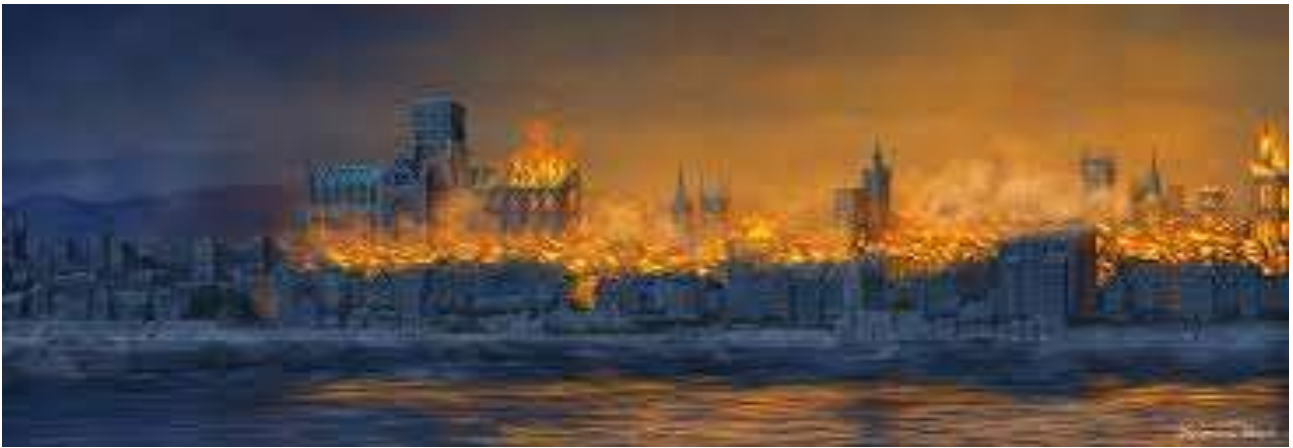
Veliki požar u Londonu 1666. godine

Francuski kralj Luj XIV je donio 1681. Ordonnances de la Marine, bazirane na ranijem tekstu poznatom kao Guidon de la Mer, kodeksu pomorskih zakona. Taj raniji tekst je objavljen 1671., no napisan je ranije, po nekima još 1570., a po Kopfu 1647. Gerathewohl smatra da taj tekst uključuje najvažnije odredbe koje su se odrazile na budući razvoj reosiguranja, te da su osnova današnjeg zakonodavstva o osiguranju. Glavna odrednica navedenih propisa je da je reosiguranje izričito odobreno, tako da se mogao prenijeti cijeli rizik ili samo dio rizika.